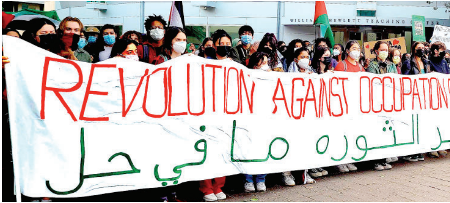
Students rally for divestment from HP on Jan. 26, where they were joined by a contingent of healthcare workers from Grant's hospital.

dedujeron que el éxito de la campaña depende de ir más allá de un grupo de activistas y era necesario construir una base que abarcara todos los diferentes sectores de la universidad. Esto debería incluir diferentes grupos de estudiantes de todos los grados, así como estudiantes de postgrado, maestros, trabajadores de la universidad, laboratoristas y trabajadores de la salud. En resumen, debía incluir a todos.