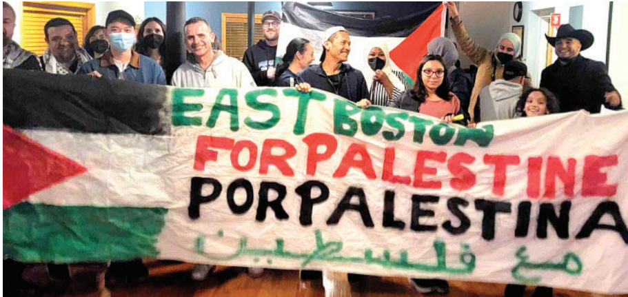
Miembros del grupo East-Boston Por Palestina, posando para la foto después de un evento.