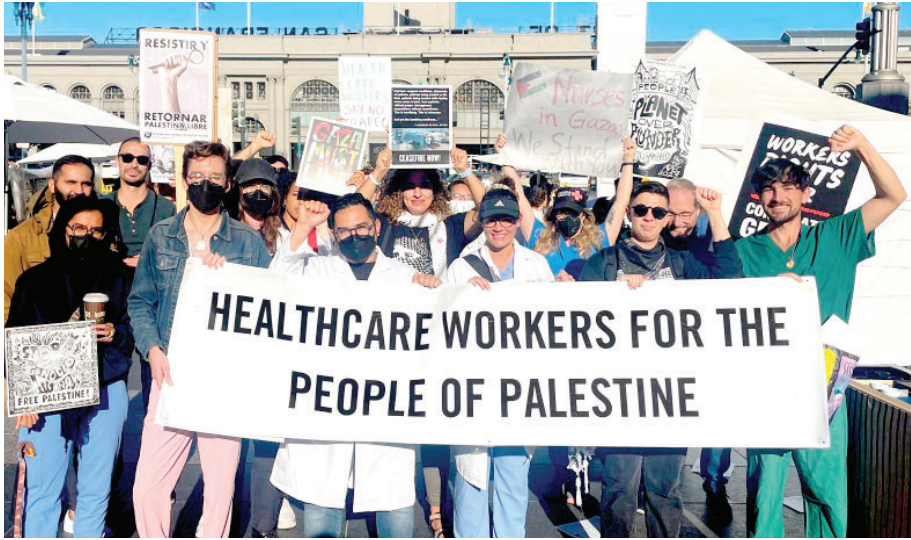
Trabajadores de la salud de varios hospitales, posan para la foto después de una manifestación en San Francisco.