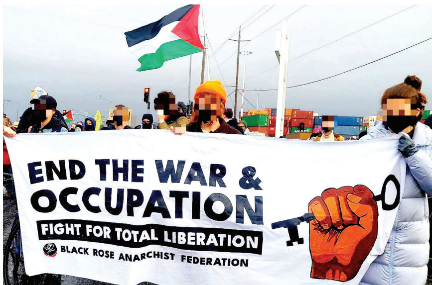
Miembros de BRRN participan en acciones para bloquear el Puerto de Oakland.

La meta actual es detener los intentos de los Estados Unidos para suplir las armas que están causando el genocidio del pueblo Palestino. Esto no será fácil, por lo que debemos esperar una lucha larga y compleja. Al enfocar nuestros esfuerzos en movimientos en la sociedad donde convivimos a diario, nos ayudará a vencer el ciclo de fatiga de las protestas activistas y crear un poder anti-imperialista mundial que viene directamente de los trabajadores.