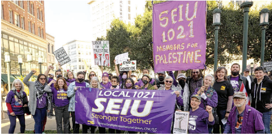
SEIU 1021 miembros de la marcha Trabajadores Por Palestina en Oakland.